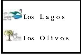
Tabla de Equivalencias