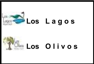
Tabla de Equivalencias